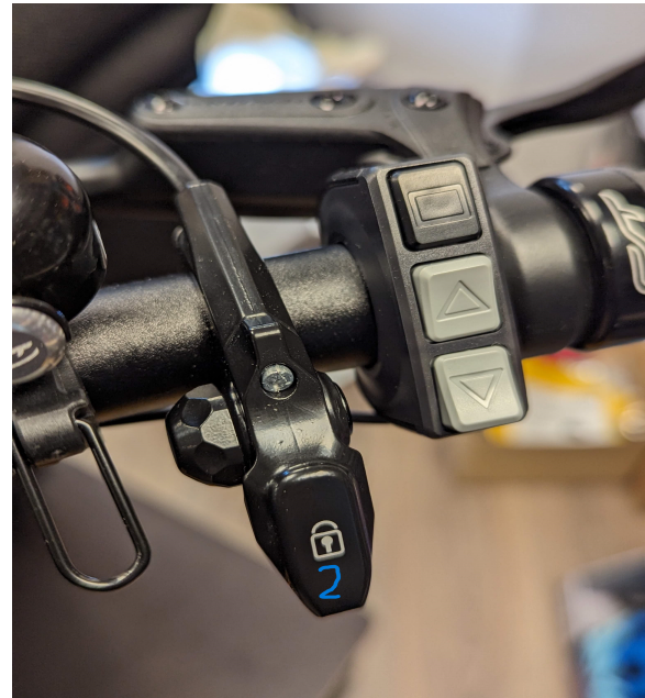
Freigegebene Neigetechnik sperren