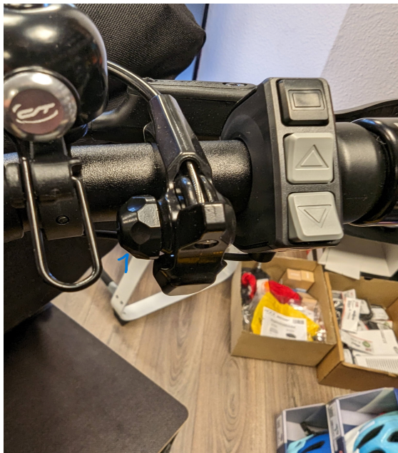
Gesperrte Neigetechnik freigeben

Der Schalthebel steuert einen Fixierungsstift im Fahrwerk. Freigegeben heißt: der Rahmen lässt sich zum Fahrwerk neigen. Gesperrt heißt: der Stift fixiert Radrahmen mit Fahrwerk senkrecht zueinander. Sollte der Schalthebel klemmen, so kann durch leichtes Kippeln des Rades (mit dem Lenker) nachgeholfen werden.