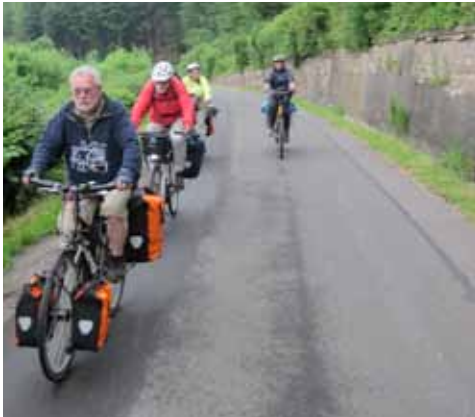
Irgendwo in der Kalkeifel.

An einem Freitag im Juni 2012 traf sich am Bayer-Löwen eine Gruppe Unkaputtbarer zum Start in die Eifel. Als wenn Petrus es gewusst hätte, dass es sich um einen Haufen ganz harter Zeitgenossen handelte, öffnete er erst einmal alle Schleusen. Das hatte den Effekt, das wir alle am Bahnhof Deutz wach waren (und ein wenig nass).