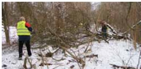
Hier geht es durch. Es sind nur sechs Kilometer.

Diese Arbeiten stellen einen wichtigen Anteil der „Muskelhypothek“ dar, also die „geldwerten“ Eigenanteile des Fördervereins, ohne