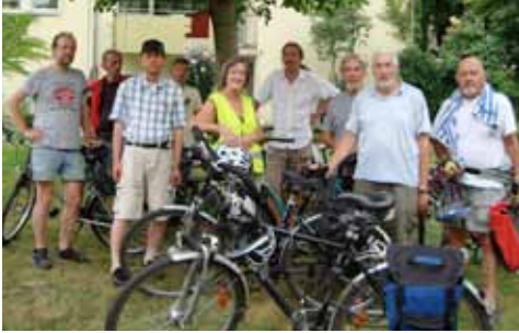
Die Zusammenstellung der Gruppe ändert sich schon mal.