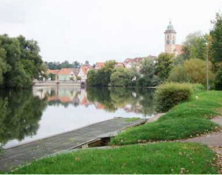
Nürtingen am Neckar

bis nach Mannheim, wo der Neckar in den Rhein fließt. Der schwäbische Dialekt wird ständiger Begleiter sein. Ein Besuch der freien Reichsstadt Rottweil, das Schloss Bebenhausen, der Hundertwasser-Regenturm, das Residenzschloss in der Barockstadt Ludwigsburg, das Schiller-National-Museum, das Deutsche Fahrradmuseum und einiges mehr werden die kulturellen Höhepunkte unserer Rad Reise sein.