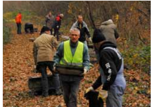
Hundert Tonnen Kabelkanäle müssen entsorgt werden.

Alle Erfolge des Fördervereins wären allerdings nicht möglich gewesen ohne die großartige Unterstützung der Mitglieder und vor allem zahlreicher Spender. Die kleinen Spenden sind das Herz eines Bürgervereins, auch wenn die größte Einzelspende einer Privatperson immerhin 10000 Euro betrug. Die „Anteilscheine“ – Spenden, die symbolisch mindestens einem Meter Balkantrasse, also 70 Euro, entsprechen – waren und sind ein „Renner“. Inzwischen hat der Schatzmeister des Vereins rund 400 Anteilscheine ausstellen können.