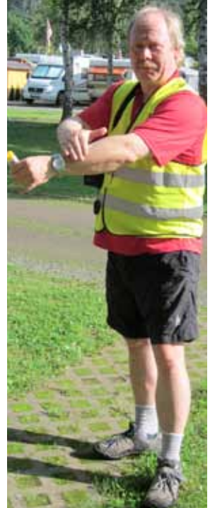
Der Autor sorgt sich um seinen Teint.

Nach einem guten Frühstück und gut verpackt ging es dann bei „strömendem Sonnenschein“ an der Ahr entlang Richtung Rhein. Das trug dazu