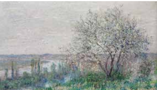
Claude Monet Frühlingsstimmung bei Vétheuil. Wallraf-Richartz-Museum & Fondation Coboud.