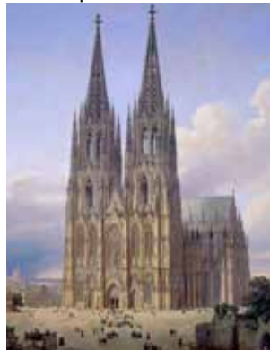
Idealansicht des Kölner Doms vor der Vollendung, 1834 bis 1836, von Carl Haesepflug. Ford Taunus 17 M, 1960–1964.

Die Sonderausstellung „Achtung Preußen!“ (bis zum 25. Oktober) ist eine mentalitätsgeschichtliche „Tiefenbohrung“, die nach den vielfältigen Spuren der preußischen Zeit in Köln und im Rheinland fahndet. Ausgangspunkt sind die gängigen Klischees, die sich mit „Rheinland“ und „Preußen“ verbanden – und die sich von 1815 an bis heute erhalten haben. Anhand von besonders aussagefähigen Exponaten werden 22 Geschichten erzählt, in denen rheinisch-preußische Klischees bedient, korrigiert oder in Frage gestellt werden – historisch seriös, kritisch aufbereitet und auch mit einem Augenzwinkern. Präsentiert wird die Ausstellung an einem authentischen Ort der preußischen Zeit – der 1841 erbauten