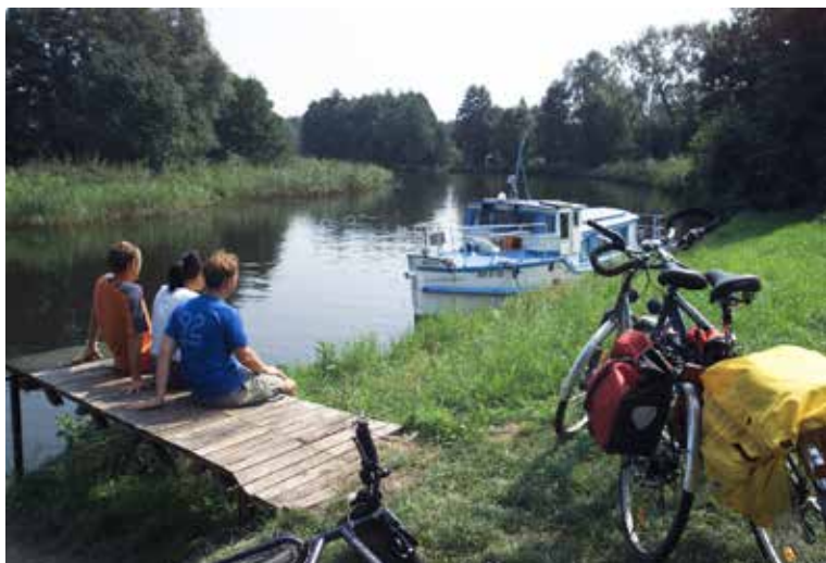
Pause an der Havel.

Die Tourenangebote findet man auch im neu erschienenen Reisekatalog. Dieser kann beim Reiseveranstalter „Aktiv-Reisen-Berlin-Brandenburg“, Sperlingshof 28, 14624 Dallgow-Döberitz, Telefonnummer 03322 25616 oder per E-Mail unter info@aktiv-reisen-bb.de kostenlos bestellt werden. Die Angebote sind auch im Internet unter www.aktiv-reisen-bb.de buchbar. Ansprechpartner: Gerd Koallick, Sperlingshof 28, 14624 Dallgow-Döberitz, Telefonnummer 03322 2560, E-Mail info@aktiv-reisen-bb.de .