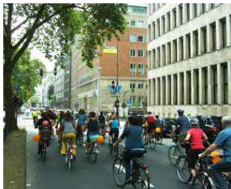
Fahrradsternfahrt Köln, Hohemzollernring, 2012.

Auch in diesem Jahr nehmen wir wieder an der Kölner Fahrradsternfahrt teil. Unter Polizeigeleit fahren wir in einer geschlossenen