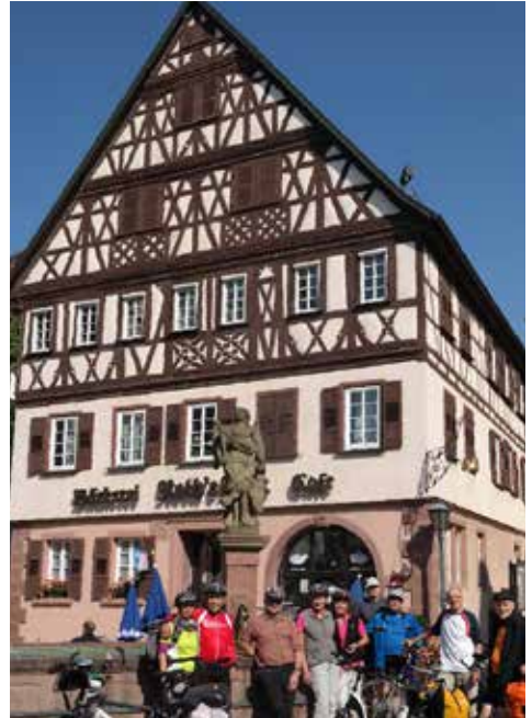
Marktbrunnen in Neudenau.

Hinter Bad Schwäbisch Hall unterquerten wir die Kochertalbrücke, Europas höchste Stahl-