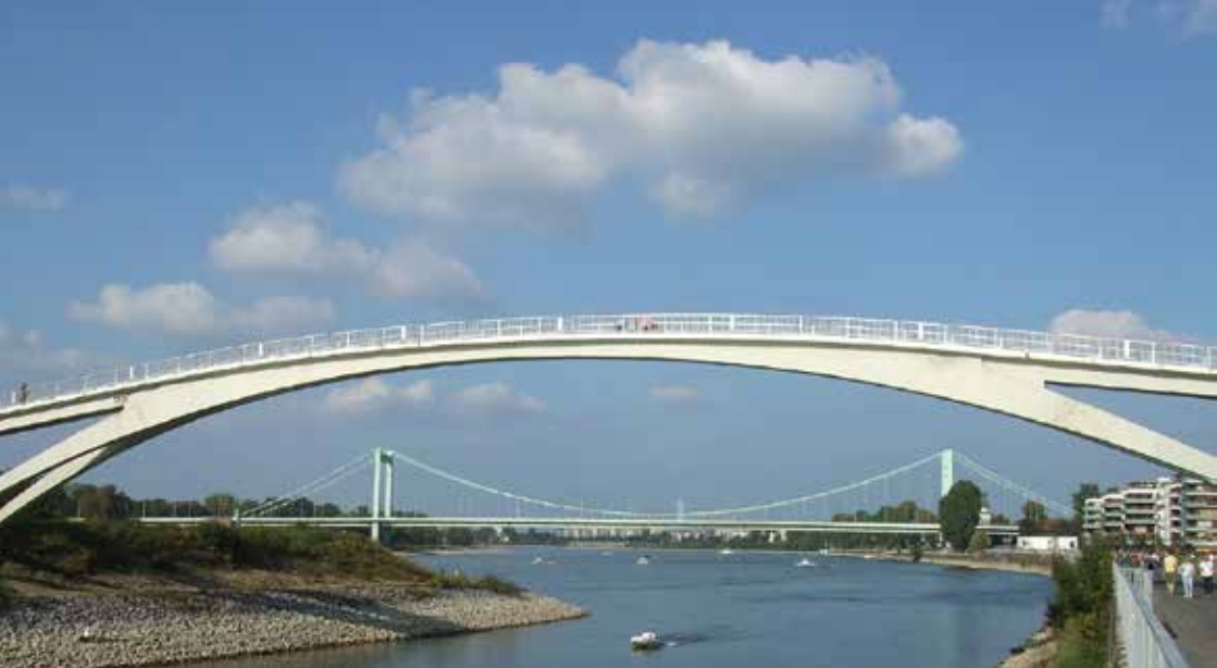
Km 12: Hafen- und Mülheimer Brücke.