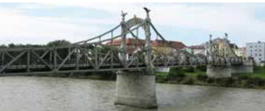
Salzachbrücke bei Oberndorf.

Am nächsten Tag schwingen wir uns wieder auf die Räder, und es geht am linken Salzachufer entlang Richtung Salzburg. Kurz vor Anif verlassen wir den Flussradweg, um einen Abstecher zum Schloss Hellbrunn zu machen. Vom Weg aus sehen wir das Untersberg-Massiv, und über das dörfliche Anif geht es in einem weiten Bogen durch den Park von Schloss Hellbrunn. Zu so früher Stunde sind erst wenige Leute da. So genießen wir eine kurze Runde am Schloss vorbei und durch den Park mit seinen Fischteichen. Über die für den Autoverkehr gesperrte Hellbrunner Allee