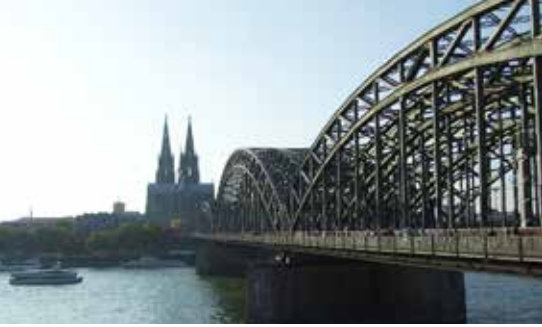
Km 14,9: Hohenzollernbrücke. 16,5 km: Groß Sankt Martin, unten: Blick von der gleichen Stelle aus im Jahre 1946. Rechts: 17,1 km: Hafeneinfahrt.