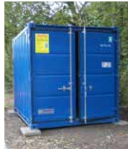
Materialcontainer, Spende des Vereins „Wir & Leverkusener“, aufgestellt Ölbachstraße, Höhe ehemaliger Bahnhof Bergisch Neukirchen. Links: Sitz-(Picknick)gruppe am Treffpunkt Balkantrasse, Obstwanderweg.

Die Kosten dafür gelten indessen als „nicht förderfähig“, das heißt, sie müssen vom Förderverein voll getragen werden, während der eigentliche (Aus-)Bau des Rad- und Wanderwegs vom Land großzügig mit 80 Prozent bezuschusst wird. Doch auch hier erwies sich,