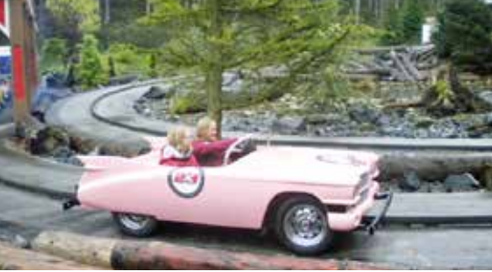
Im Freizeitpark, Picknick in der Bushaltestelle, Fledermaustunnel.

selbst schiebend in zwei Stunden zu schaffen, unser Essen haben wir bekommen, und es blieb sogar noch Zeit, die erste Achterbahn und das Kettenkarussell auszuprobieren. Der Tag im Vergnügungspark verlief wie erhofft, wegen des nicht hundertprozentig guten Wetters gab es meistens gar keine oder höchstens sehr kurze Wartezeiten an den Attraktionen.