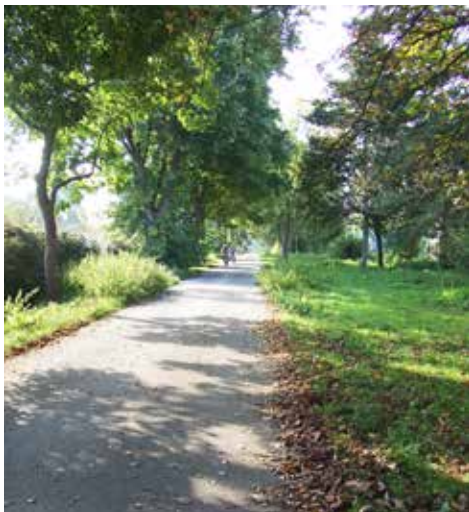
Km 3,5: Weg nach Flittard.

Auf der Otto-Bayer-Straße zur B 8 fahren und dort hinter der Ampel auf dem Radweg in Richtung Flittard fahren. 3,5 km: Nach rechts auf den Rad-Fußweg abbiegen.