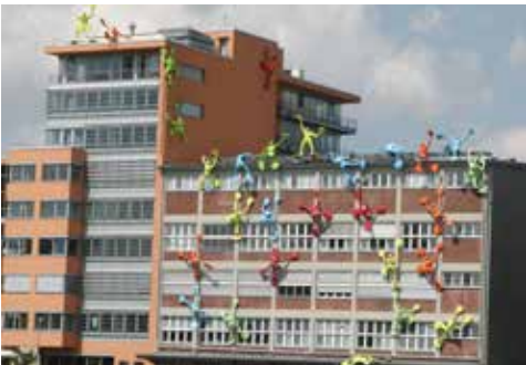
Medienhafen in Düsseldorf

Wir fahren die Rheinschiene entlang und erreichen über Monheim die Landeshauptstadt Düsseldorf. Innerhalb von Düsseldorf folgen wir den Rheinschleifen und erleben den Hafen, die Altstadt und fahren am Flughafenge-