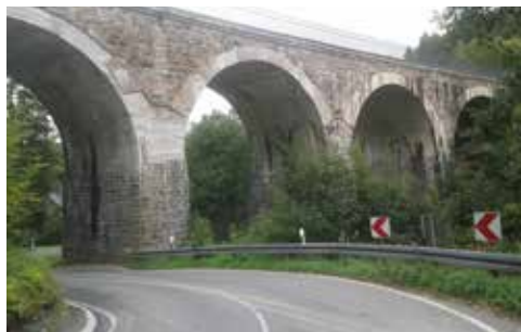
Vennbahntrasse - Viadukt bei Reichenstein