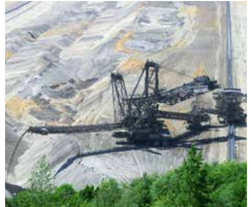
Braunkohletagebau Hambach - Absetzer

Eine schöne Strecke rund um das größte Loch der Welt und quer über die Sophienhöhe. Der Tagebau Hambach ist für die Region prägend und ein extremer Eingriff in die Natur. Um die Ausmaße und die Belastungen für Mensch und Natur zu „erfahren“ und besser zu verstehen, geht die Tour entlang der Kante des Tagebaus vorbei an der Sophienhöhe durch Dörfer und