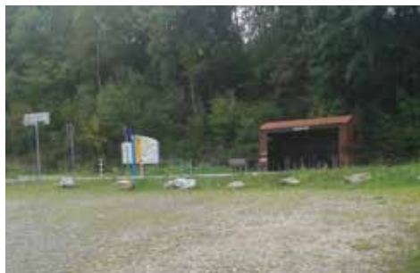
Vennbahntrasse - ehem. Bahnhof Reichenstein