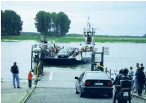
Autofähre „Fritz Middelanis“

http://www.hgk.de/leistungen/rheinfaehre/preise