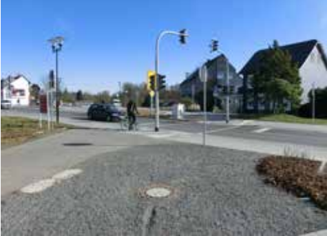
Balkantrasse Übergang in Hilgen

ken wir uns dort für die Rückfahrt, die uns über die Rausmühle in Löh zur Belohnung auf die Balkantrasse führt. Nach dem vielen Klettern mit dem Rad geht es über die Balkantrasse immer bergab zurück nach Leverkusen. Tagestour mit Einkehr. Schwierigkeitsgrad: mittelschwer mit Steigungen, ca. 75 km. Treffpunkt: 9 Uhr, Leverkusen-Mitte, Forumvorplatz, Anmeldung erforderlich. Kosten: ADFC Mitglieder frei*, Gäste fünf Euro.