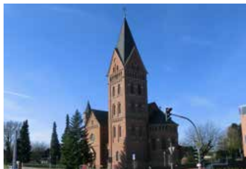
Kirche St. Nikolaus in Neuboddenberg