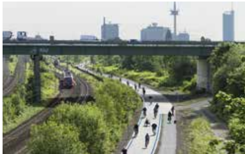
RS1 Essen

Syring: Die Stadt Bergisch Gladbach, die Stadt Köln, die Stadt Leverkusen, der Rhein-Sieg-Kreis und der Rheinisch-Bergische Kreis haben sich