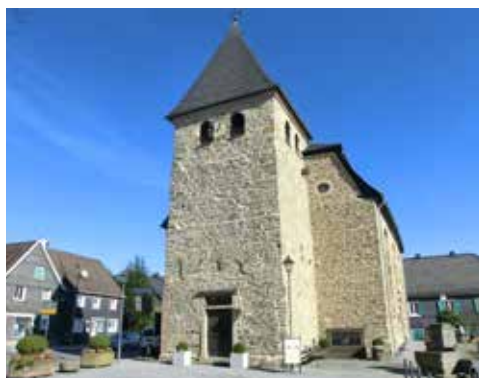
Kirche „Der Alte von Berg“ in Witzhelden