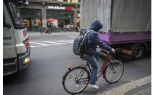
Enge in den Städten

Die bestehenden Verkehrsprobleme können nicht mit den bisherigen Ansätzen und Lösungen bewältigt werden. Ein Umdenken im Verkehrsverhalten ist dringend erforderlich. Eine Herausfor-