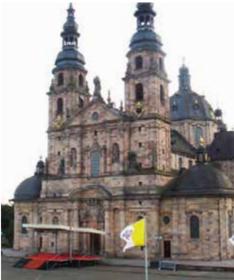
Dom zu Fulda

Weiter ging es auf dem Leine-Heide-Radweg durch die Lüneburger Heide nach Walsrode. Der Leine-Heide-Radweg führt ca. 400 km von der Quelle der Leine über Göttingen und Hannover nach Hamburg. Leider war durch den Regen des vergangenen Tages der Sand der Heide sehr klebrig und blockierte manchmal meine Bremsen. Deshalb versuchte ich,