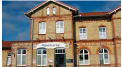
Bahnhof Süderbrarup

Im Norden Schleswig-Holsteins, im Dreieck von Flensburger Förde, Ostsee und dem Ostseefjord Schlei, liegt das Land Angeln. Dort