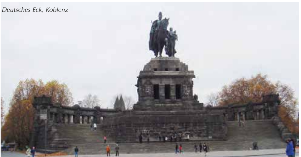
Deutsches Eck, Koblenz