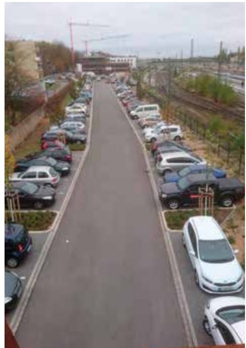
P+R Parkplatz

Wenn es sich um neue Parkplätze handeln würde, wäre die gesamte Maßnahme innerhalb von sechs Wochen abgeschlossen. Da es sich aber NUR um einen Radweg handelt, reagieren die „TBL“ eher verhalten, als wenn es keine Eile hätte. Es ist aber Eile geboten! Die Stadt Leverkusen hat den RadfahrerInnen die Fertigstellung des Panorama-Radweges schon vor zwei Jahren versprochen. Jetzt können die umweltfreundlichen Verkehrsteilnehmer erst im dritten Quartal 2019 mit der Fertigstellung