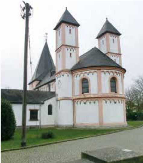
St. Amandus, Rheinkassel

Schwierigkeitsgrad mittel, circa 80 km. Treffpunkt: 9 Uhr, Fähranleger Langel. Kosten: ADFC-Mitglieder frei*, Gäste fünf Euro. Leitung Manfred Braun, Telefon 0179 6727624