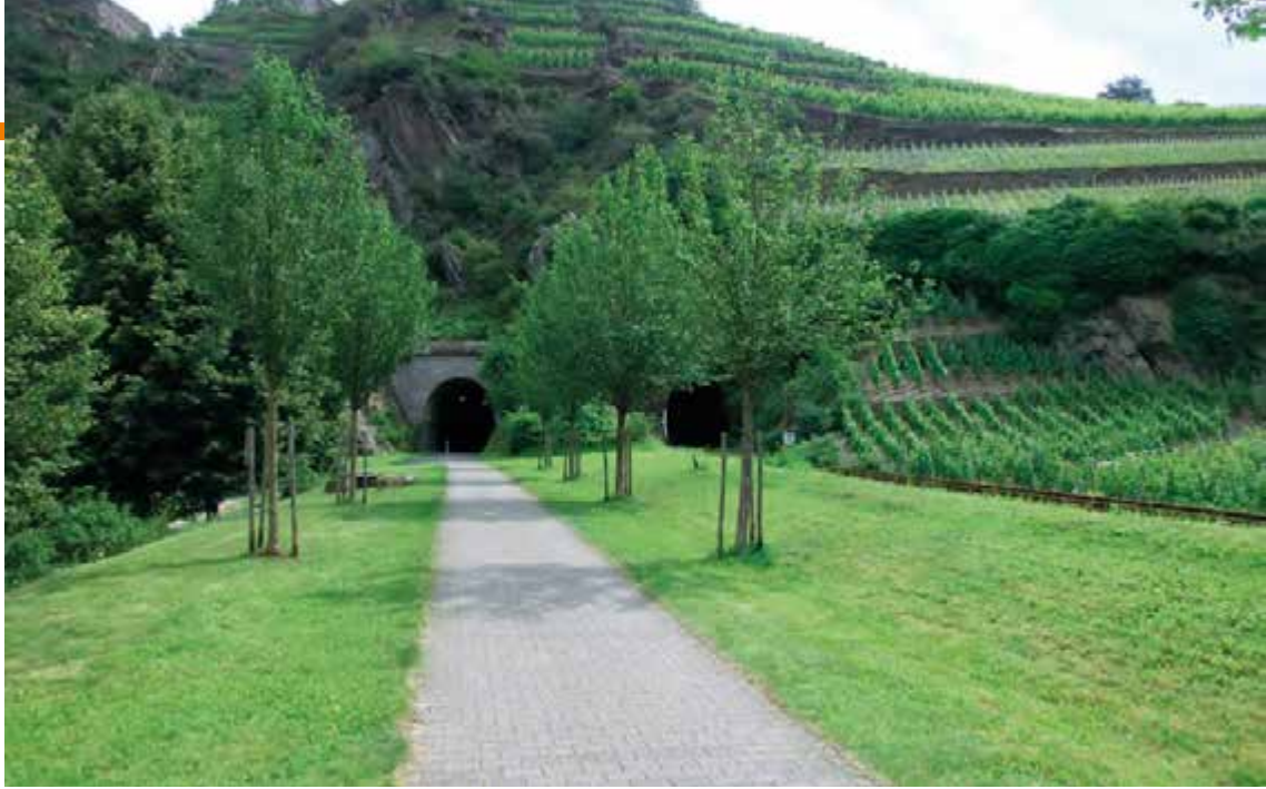
Ahrradweg, ehemalige Bahntrasse

berg und weiter auf dem Vulkanradweg zum Nürburgring mit Mittagseinkehr. Anschließend geht es über Adenau mit teilweise neuem Bahntrassenradweg nach Dümpelfeld an die Ahr bis nach Ahrbrück. Von dort mit der Bahn über Remagen und Köln zurück nach Leverkusen. Schwierigkeitsgrad schwer, Pedelecs erforderlich, circa 80 km. Treffpunkt: 7.40 Uhr, Bahnhof Leverkusen Mitte. Kosten: ADFC-Mitglieder frei*, Gäste fünf Euro, zuzügl. VRS Gruppenticket.