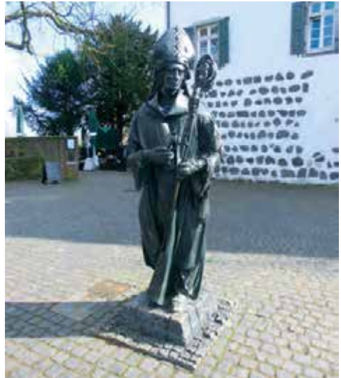
Friedrich von Saarwerden 1348-1414 erbaute Zons