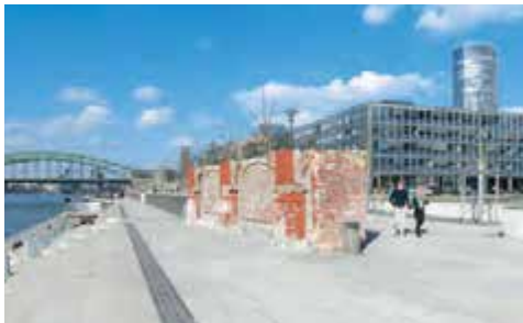
Reste preußischer Bahndammmauer