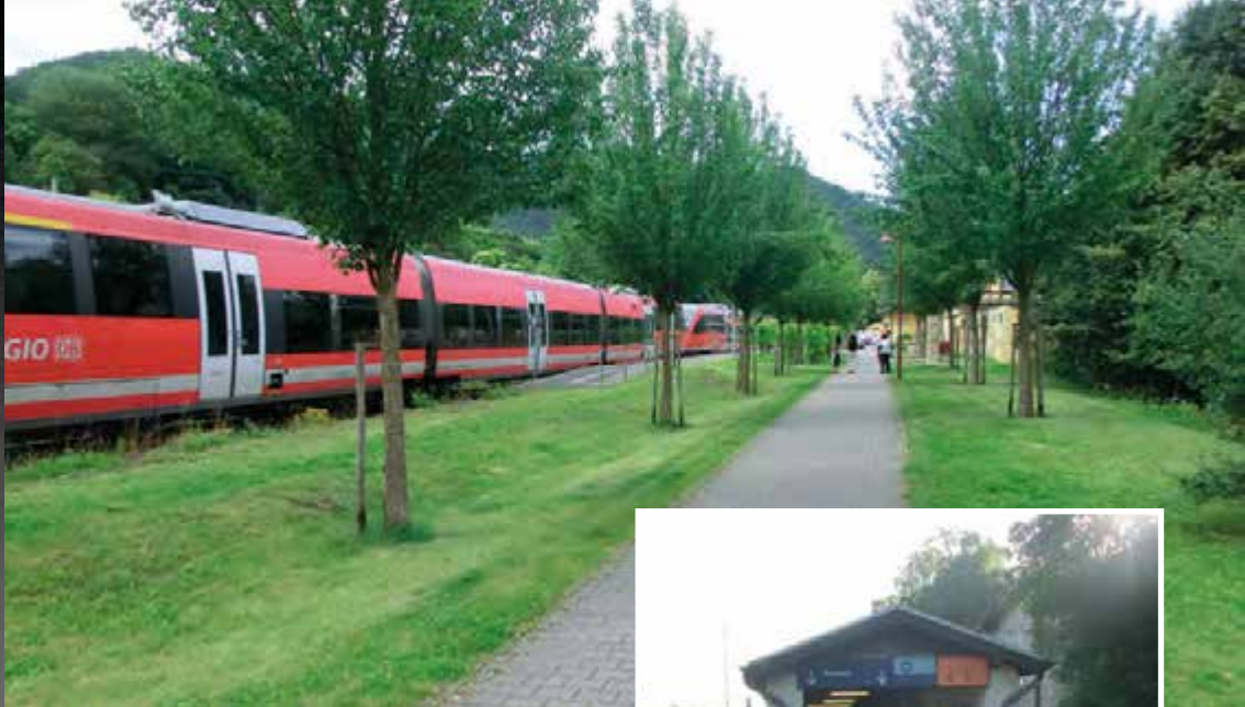
Ahrtalbahn mit Ahrradweg