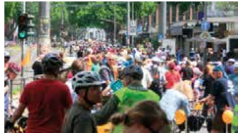
Köln 2017

Wir nehmen an diesem Sonntag an der 11. Kölner Fahrradsternfahrt teil. Unter Polizeileitung fahren wir in einer geschlossenen Gruppe