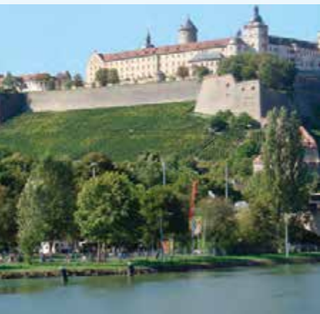
Festung Marienberg Würzburg