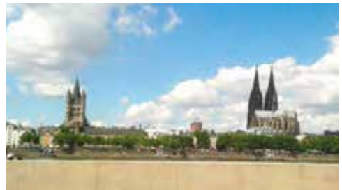
Panorama Köln