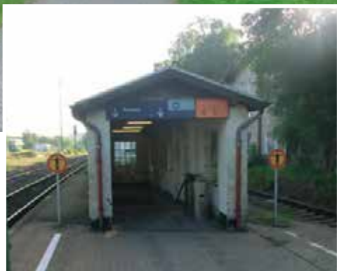
Bahnhof Blankenheim Wald

Wir fahren mit der DB ab Leverkusen Mitte um 08:56 Uhr über Köln/ Deutz zum Bahnhof Blankenheim Wald. Von dort über Blankenheim auf dem Ahradweg bis Ahrhütte. Sodann durch das Naturschutzgebiet der Wacholderheide Lampertsbachtal auf dem Eifelhöhenradweg über Alendorf und Waldorf, Nonnenbach, Blankheimerdorf und weiter an der Eifelbahn entlang durch das Urfttal über Netters-