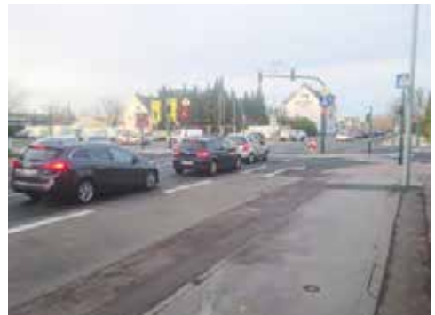
Kreuzung Quettingerstraße

Es geht so weiter in der Reihenfolge und beginnt immer mit der Phase 1. Ein zusätzlich beauftragtes externes Gutachten hatte in der Reihenfolge der Wechsellichtzeichen keine unmittelbare kausale Verknüpfung erkennen können.