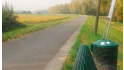
Langer Damm

Spargeltour Die leichte, flache Tour befasst sich mit dem „weißen Gold“ der rheinischen Ebene. Wir überqueren den Rhein in Leverkusen und folgen ihm bis Worringen. Dann geht es Richtung Knechtsteden, wo sich die Spargelfelder befinden. Einkauf beim Spargelbauern, dem Barbarahof, ist möglich. Tagestour mit Einkehr.