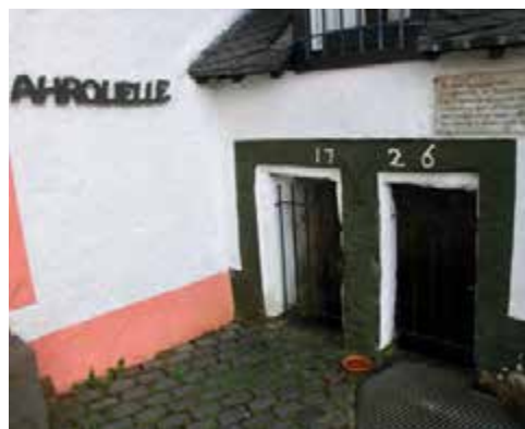
Ahrquelle in Blankenheim

Anmeldung erforderlich, 12 Teilnehmer Leitung: Manfred Braun, Telefon 0179 6727624