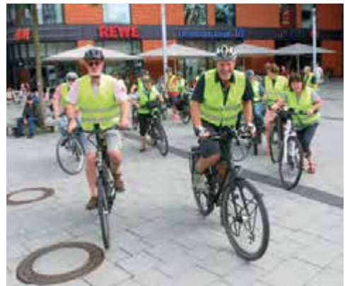
Beginn des Stadtradelns 2018

Das STADTRADELN soll das umweltfreundliche Verkehrsmittel Fahrrad weiter als alltagstauglich etablieren und auf Dauer die Rahmenbedingungen dafür verbessern. Daher sind auch explizit die Politiker als Teilnehmer angesprochen, denn gerade sie sollen Radwege, Ampelschaltungen für Radfahrer und die Ausschilderung erfahren, um für eine Verbesserung dieser Infrastruktur sensibilisiert zu werden.