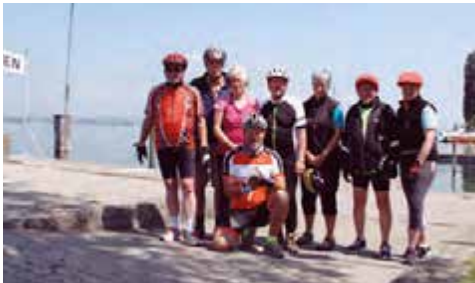
Bodensee-Radtour 2018

Die Unterkünfte liegen in Konstanz, Meers-