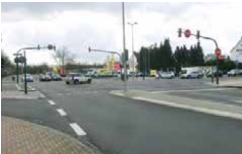
Kreuzung Quettingerstraße