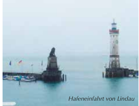
Hafeneinfahrt von Lindau

Ab jetzt wurde es dann ganz einfach, immer den Rhein folgen, dann kommst du richtig an.