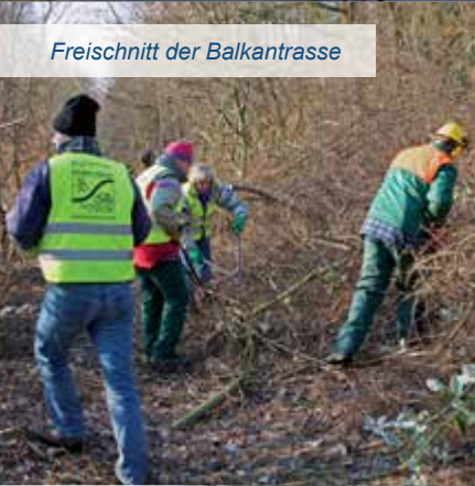
Freischnitt der Balkantrasse