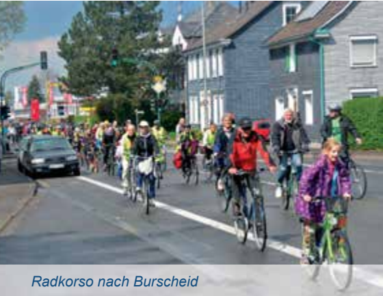
Radkorso nach Burscheid

Das Projekt Balkantrasse Leverkusen, sozusagen ein „Kind“ des ADFC, ist weiterhin auf Erfolgskurs. Nachdem zu Beginn des Jahres 2012 – nach Abschluss des Kaufvertrags mit der Bahn über das knapp sechs Kilometer lange und rund 160000 Quadratmeter große Trassenband – die Stadt Eigentümerin wurde, ist der Förderverein Balkantrasse Leverkusen e.V. voll durchgestartet; zugleich hat er einen enormen Aufschwung erlebt.