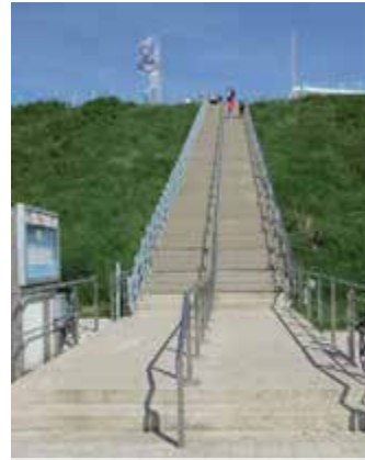
Aufgang zum Monberg

Marienburg: Vor über 130 Jahren von einem Reichstagsabgeordneten gebaut. Der Name sollte an den Hauptsitz des Deutschen Ritterordens in Westpreußen erinnern. Das Gebäude ist in Privatbesitz, ein großer Teil des Parks gehört der Stadt Monheim.