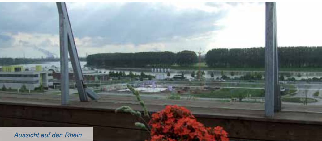
Aussicht auf den Rhein