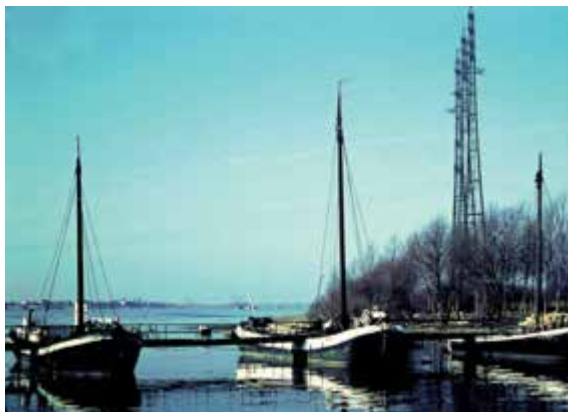
Steganlage 1967. Das Schiffstrio war gerade mit dem Aalschokker (Rheindorfer Seite) komplettiert worden.

Sorgen machen den Schiffsfreunden höchstens die unverbesserlichen Vandalen, die sich schon heute an der Baustelle zerstöre-