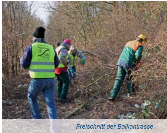
Freischnitt der Balkantrasse

Ob Radler oder Fußgänger, Inline-Skater oder Jogger,