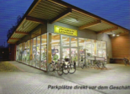
Parkplätze direkt vor dem Geschäft