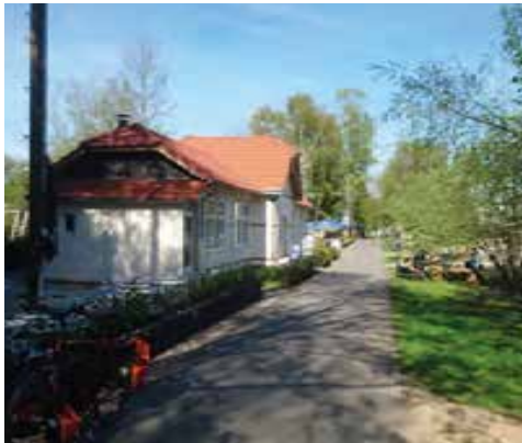
Balkantrasse, Alter Bahnhof Burscheid