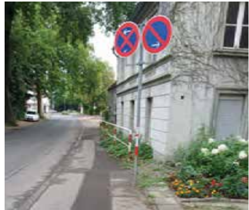
Manforter Straße

Das ist der Radweg auf der Manforter Straße in der West-Ost-Richtung. Seit über 40 Jahren und mehreren Hinweisen hat sich bis heute nichts geändert. Auch im weiteren Verlauf bis zur Einmündung der Weiherstraße ist der Radweg sanierungswürdig. Liebe Stadtverwaltung, tut bitte etwas!!! Hebt die Radwegbenutzungspflicht auf!!