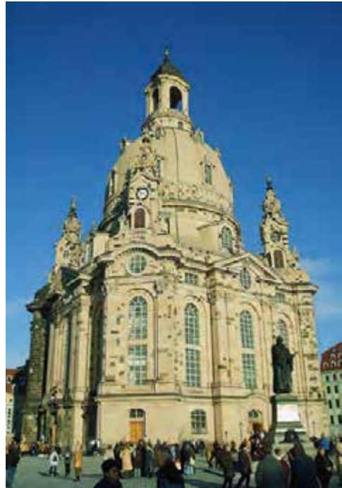
Dresdener Frauenkirche