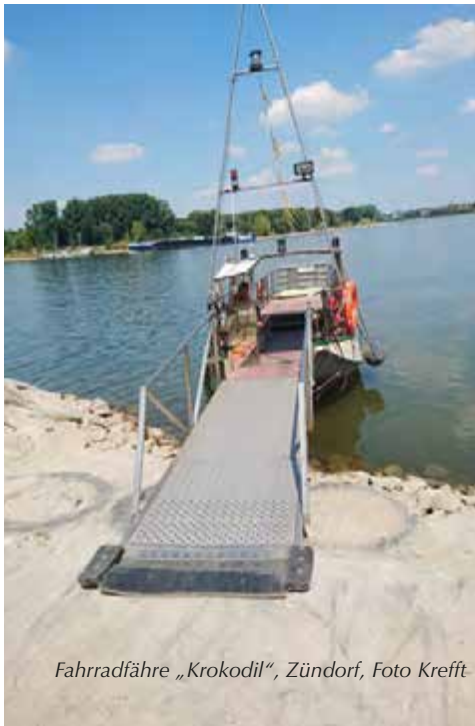
Fahrradfähre „Krokodil“, Zündorf