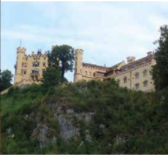
Schloß Hohenschwangau

die an diesem Tag per Handy gebuchte Unterkunft in Füssen konnte kurze Zeit später bezogen werden. Was für eine Unterkunft; direkt am Forggensee gelegen und mit herrlichem Blick auf Schloss Neuschwanstein.