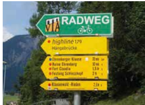
Bei Reutte

Es stand der Reschenpass auf dem Programm. Der Kommentar eines Landeckers im tiefsten Dialekt: „Seit doch nicht blöd, nehmt den Bus und dann seit ihr der Boss“. Aber so war das ja gar nicht geplant. Also am nächsten Tag aufs Rad und zum Einfahren bis nach Martina an der Schweizer Grenze. Bevor wir den Einstieg erreichten, stießen wir auf einen besonderen Radkollegen. „Diamant“, so sein Name im Rad-Forum, war auf dem Weg von Riesa über Prag und Wien nach Nizza inklusive der höchsten Alpenpässe: Großglockner, Timmelsjoch, Penserjoch (hatte er schon hinter sich), Stilsferjoch, Grimsel, Furka, Galibier und Luckmanier. Einfach Wahnsinn. Mir reichte an diesen Tag schon der Reschenpass.