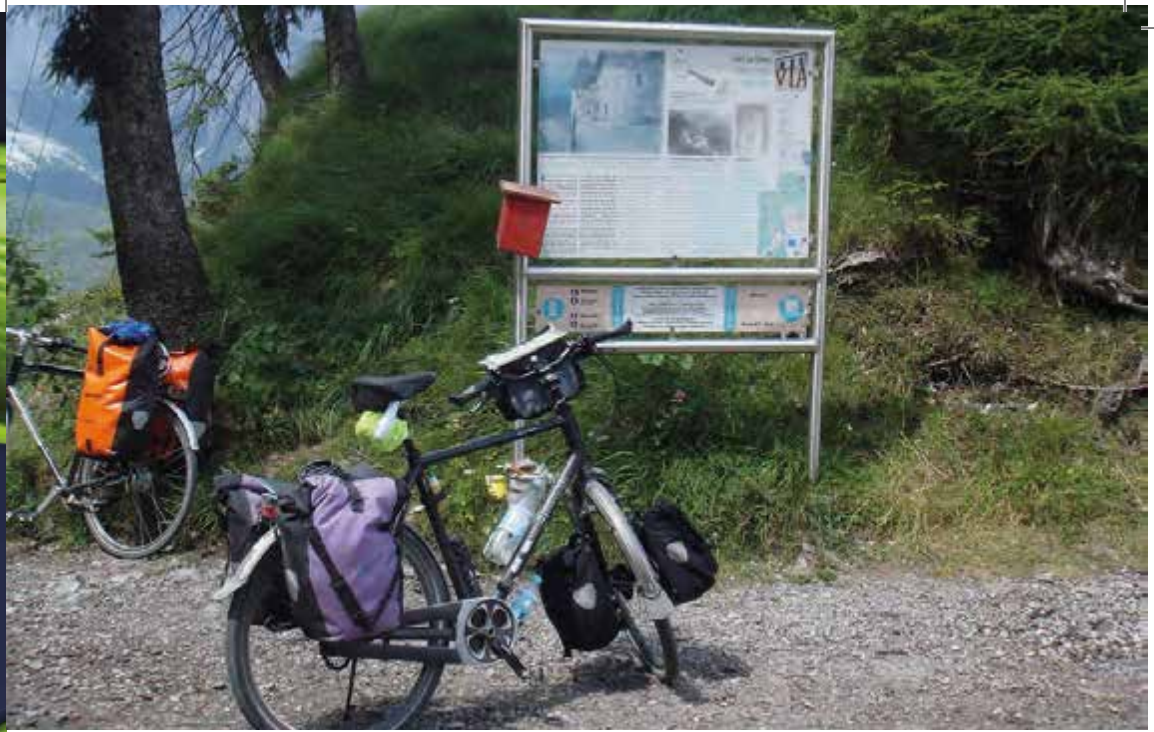
Am Reschenpass