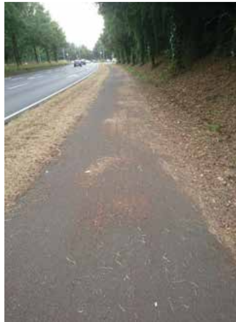
Radweg Herbert Wehner Straße

Radwege werden nach dem Mähen der Seitenstreifen häufig verschmutzt hinterlassen. Das Foto, aufgenommen an der Herbert Wehner Straße am 21. Juli 2018, ist nur beispielhaft. Auf den Autostraßen wird nach dem Mähen sofort gesäubert, warum gelingt das nicht auch auf den Radwegen? Übrigens, der verschmutzte Zustand hielt am 20.08. immer noch an. Dickes Minus!!