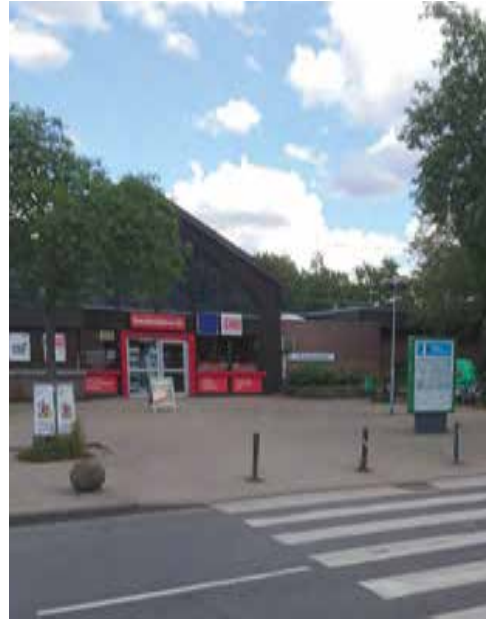
Bahnhof Leverkusen-Mitte

Leitung: Bernd Jüdt, Telefon 02171 47031