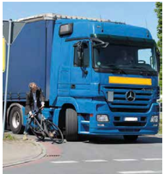
Foto Fahrrad unter LKW

Der ADFC fordert in einem Brief an das Bundesverkehrsministerium (BMVI) Minister Scheuer auf, zum besseren Schutz von Radfahrern unverzüglich eine Task Force einzurichten. Mit am Tisch sitzen müssen die Verkehrsminister-