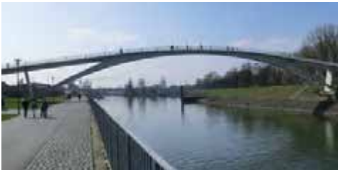
Der Katzenbuckel in Mülheim