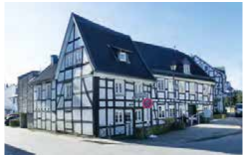
Fachwerk in Witzhelden

Wir fahren über Leichlingen durch das Weltersbachtal hinauf bis Witzhelden. In Weltersbach verbinden wir eine kleine Pause mit dem Besuch des Bibelgartens.