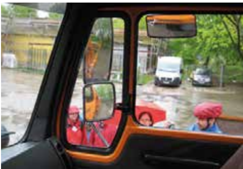
Foto Toter Winkel