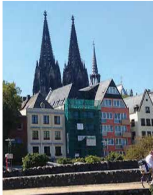
Rheinpromenade mit Dom