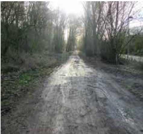
Rad- und Fußweg Reuschenberg

Der Radweg zwischen Opladen und Bürrig sieht seit Jahren so aus. Das Fahrrad, die Schuhe und die Hose sind spätestens nach