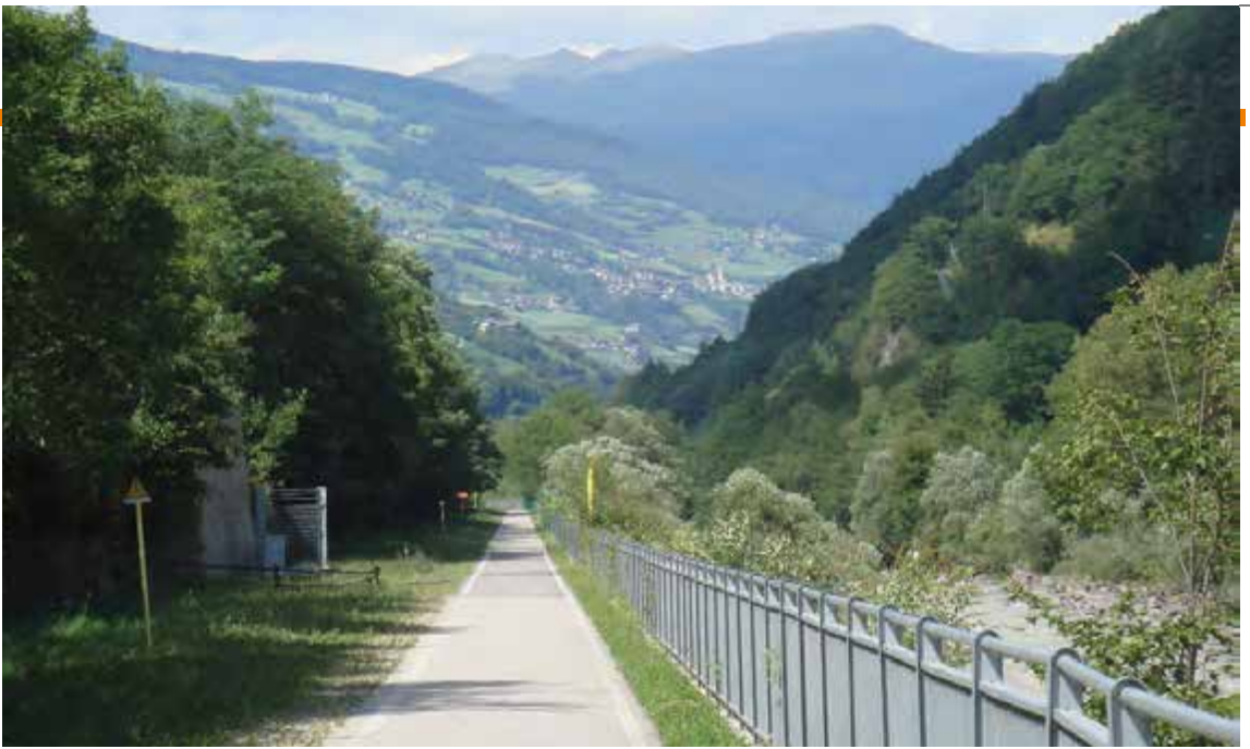
Bahnradweg an der Eisack

Weg suchen. Die letzten Kilometer bis zur Passhöhe waren dann wieder eine ehemaligen Bahntrasse, welche eine Erholung. Auf der österreichischen Seite bin ich kurzentschlossen auf der Bundesstraße geblieben. Innerhalb kürzester Zeit war ich in Innsbruck und fand eine Pension in der Nähe der Altstadt. Natürlich stand noch eine Besichtigung der Altstadt mit dem berühmten Goldenen Dachl an. Da ich seit Bozen kein Kartenmaterial mehr hatte, fragte ich den Pensionswirt über den besten Weg von Jenbach zum Achensee. Er empfahl mir entweder die Achenseebahn oder die Nebenstrasse über Kasbach zu nutzen. Diese sei zwar etwas steiler als die Hauptstrasse, aber nur sehr schwach befahren. Also entschied ich mich für die Nebenstrasse. Doch zu Beginn der Steigung verschlug es mir fast die Sprache, die Strecke war extrem steil und stark von Lkw's befahren. Diese drückten mich so stark an die Begrenzungsmauer, dass ich mir die Schutzhauben der Packtaschen aufriss. Ca. 300 m vor Maurach war dann die Luft raus, ich musste schieben und in Maurach wurde das erste Cafe angesteuert. Die Bedienung war total über-