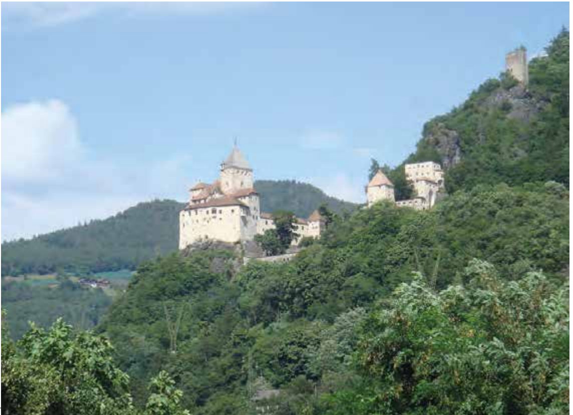
Trostburg bei Waidbruck im Eisacktal, Foto Giehl